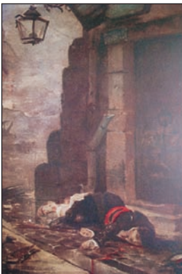
La Fédérée de l'impasse du Tertre. Adolphe Willette (1857-1926).

Peintre mais surtout dessinateur réputé. Représentant de l'esprit montmartrois par ses gravures alliant tendresse et sensualité. Ses scènes galantes où Pierrot lutine Colombine ont illustré «Le journal du Chat noir», «Le Courrier Français», «Le Rire», etc. Cependant, il n'a pas négligé la satire, parfois féroce, dans sa grande toile «Parce Domine» du musée de Montmartre et dans ses œuvres très engagées telles que «La Sainte Démocratie» symbolisée par une jolie Marianne de 1793 fort dénudée qui fit scandale et «Vive la Commune», un bel hommage à Eugène Pottier.